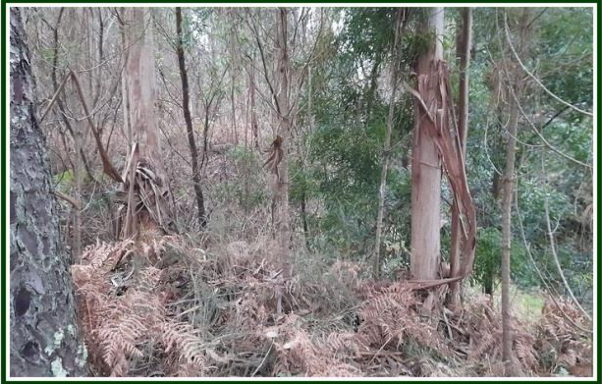
Entre as árvores o ar é mais puro (foto de 3 de janeiro de 2022)

* Quando se aproximam momentos solenes e há uma agitação no ar, cabe ouvir o silêncio. Os dias importantes merecem ser vividos com uma certa dose de calma. É a presença profunda da alma que torna verdadeiras as celebrações. A manifestação inteligente do espírito requer lucidez e tranquilidade. O correto é produzir e transmitir paz. Açúcar e álcool não ajudam.