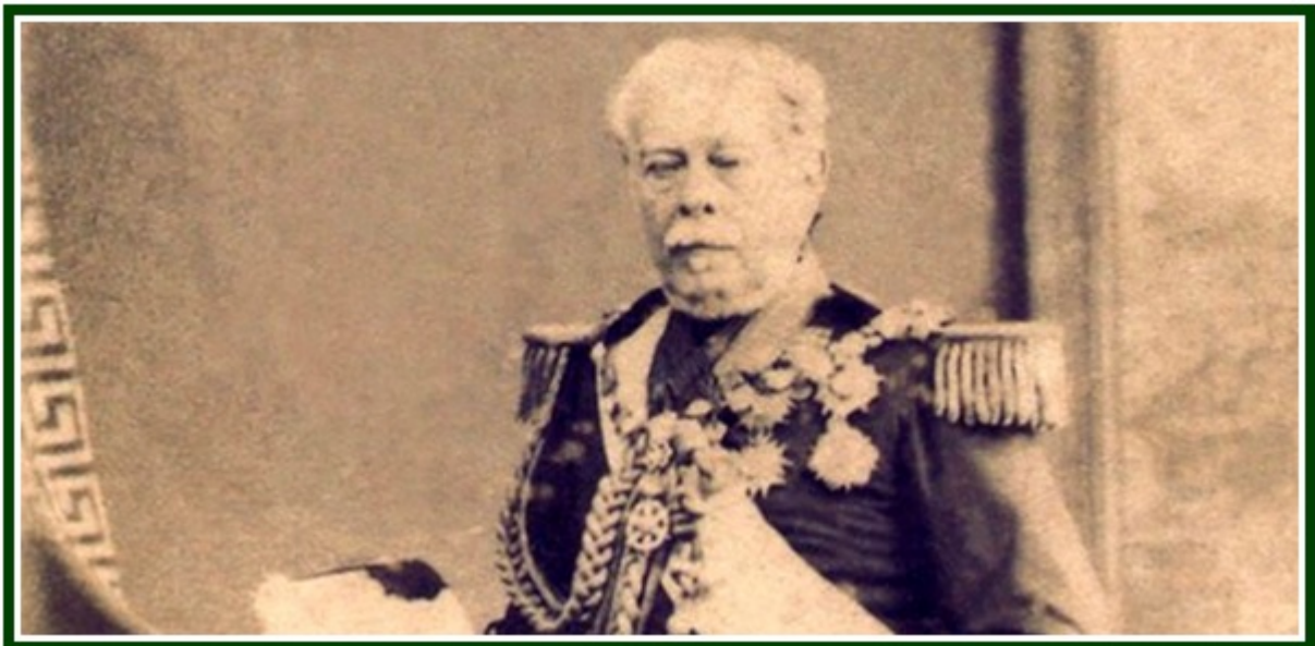
Luís Alves de Lima e Silva em 1877

Luís Alves de Lima e Silva, o Duque de Caxias, foi um grande soldado. Leal a Dom Pedro II, cumpriu papel decisivo na consolidação político-militar da unidade nacional brasileira. Amava seu país profundamente, sentimento que no século 21 precisa ser resgatado. Venceu guerras e batalhas difíceis e também soube pacificar. Respeitava os adversários.